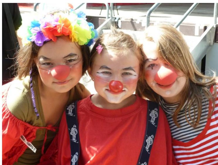
Schlussfest auf dem Thuner Rathausplatz