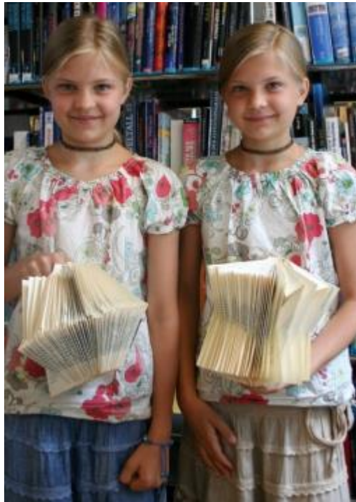
Buchfaltkunst in der Stadtbibliothek

Das Grundangebot dauerte fünf Wochen und enthielt Eintritte in Bäder/Minigolfanlagen der Region, in verschiedene Museen und Schlösser und für eine Trottifahrt vom Niederhorn sowie zu zwei Heimspielen des FC Thun und andere Vergünstigungen. Gemäss Rückmeldungen der Anbieter wurden diese Angebote alle gerne genutzt. Der STI-Kleber à CHF 15.- für freie Fahrt auf dem gesamten STI-Netz während 5 Wochen konnte beim Passverkauf und am STI-Schalter gekauft werden. Direkt haben wir nur 6 Kleber verkauft.