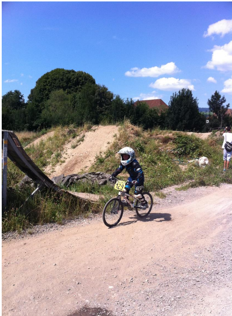
Mountainbike / BMX Dirtjump