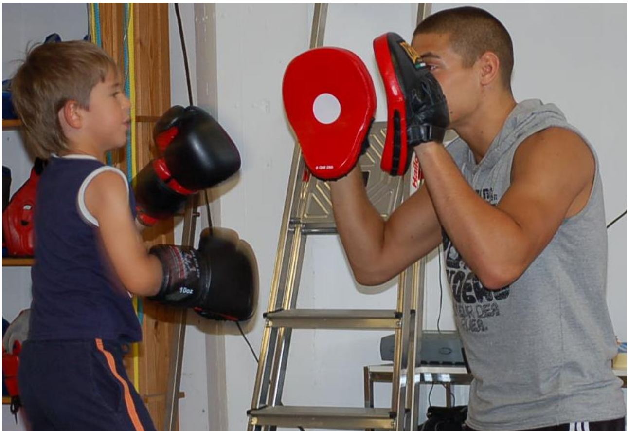
Fit und Fair durch Boxen