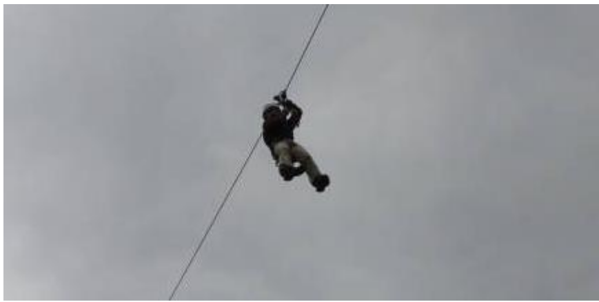
Seilpark Parcours im Rüscheegg